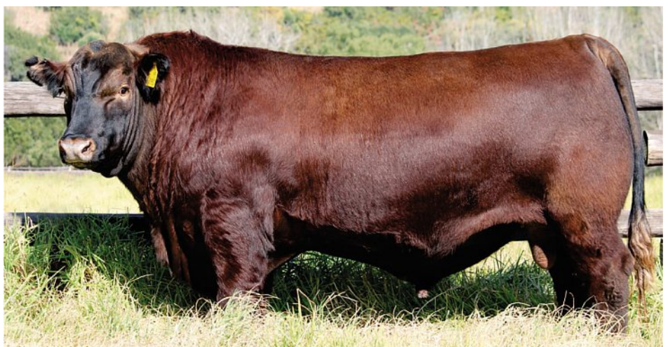
Mequatling Fireworks is verlede jaar teen 'n rekordprys van R200 000 verkoop.

Philip se algemene benadering tot boerdery is dat die meeste praktyke slegs gesonde