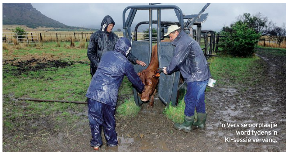
'n Vers se oorplaaie word tydens 'n KI-sessie vervang.

Waardetoevoeging in die bedryf, soos met die handelsmerkprogram Angus Beef. Die Mequatling-stoetery is tans een van die grootste verskaffers aan die SA Angusgenootskap se veldtog van handelsmerkbevestiging. Pick n Pay verkoop tans Certified Angus Beef, die suksesvolste gesertifiseerde handelsmerk vir beesvleis in Suid-Afrika. Dit is 'n groot voordeel van die Angusras, want Anguskalwers is in aanvraag by voerkrale.